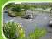
Ruang Lotak Kereta Perawat