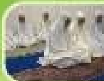
Sembayang Maghrib, Tepak dan Tambah Berjamaah dijay dengan Jamuan Mawar